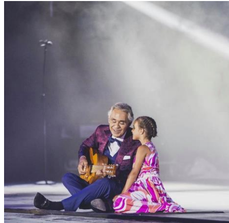
Andrea Bocelli Concert i Silenzio, Lajatico 2019